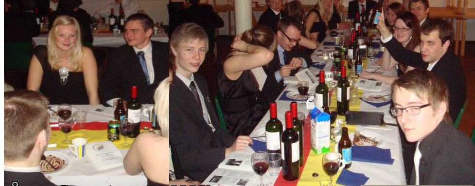
Årsfest + sillis